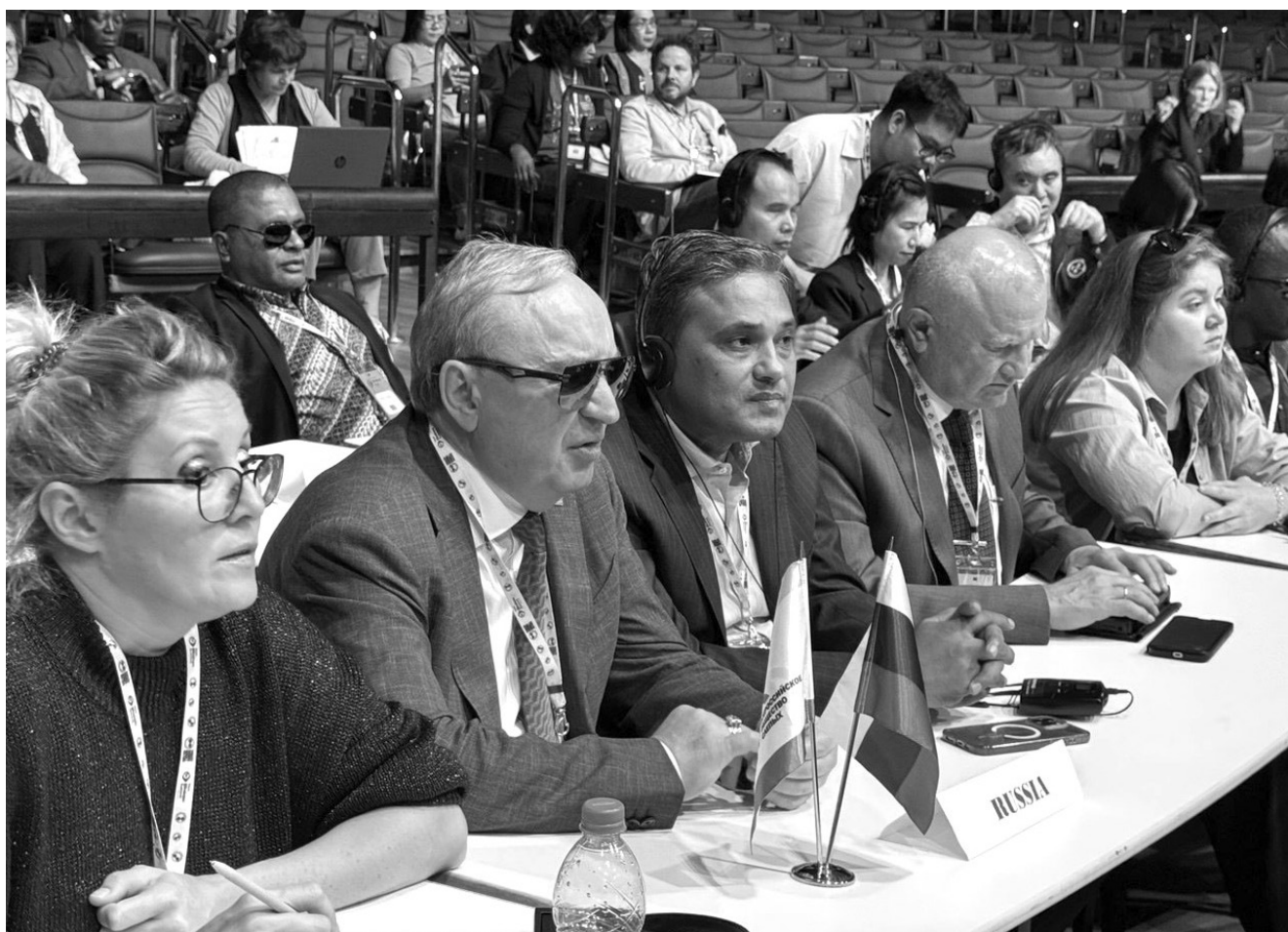
Делегация ВОС в Сан-Паулу.

Программа форума была насыщена сессиями и пленарными заседаниями, посвящёнными ключевым вопросам: реализации глобальных прав людей с нарушениями зрения, созданию доступной среды в различных областях, обеспечению инклюзии и другим важным аспектам.