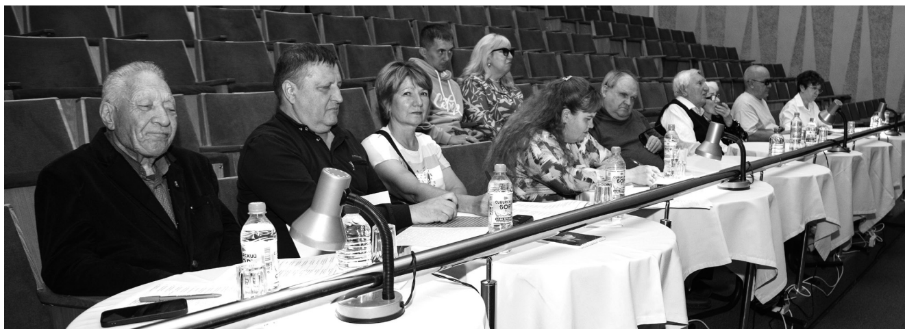
Жюри болело за всех.

ны звучали номера в самых разных жанрах: рок и поп-фолк, джаз и мюзикл, и конечно, советская и современная российская эстрадная классика. Один за другим сменялись исполнители, каждый из которых — яркая индивидуальность. Но — ложка дёгтя! — выбор репертуара некоторых участников был далёк от того, что рекомендуется для исполнения на эстрадном конкурсе. В отличие от развлекательных программ, здесь явно неуместен шансон и иже с ним.