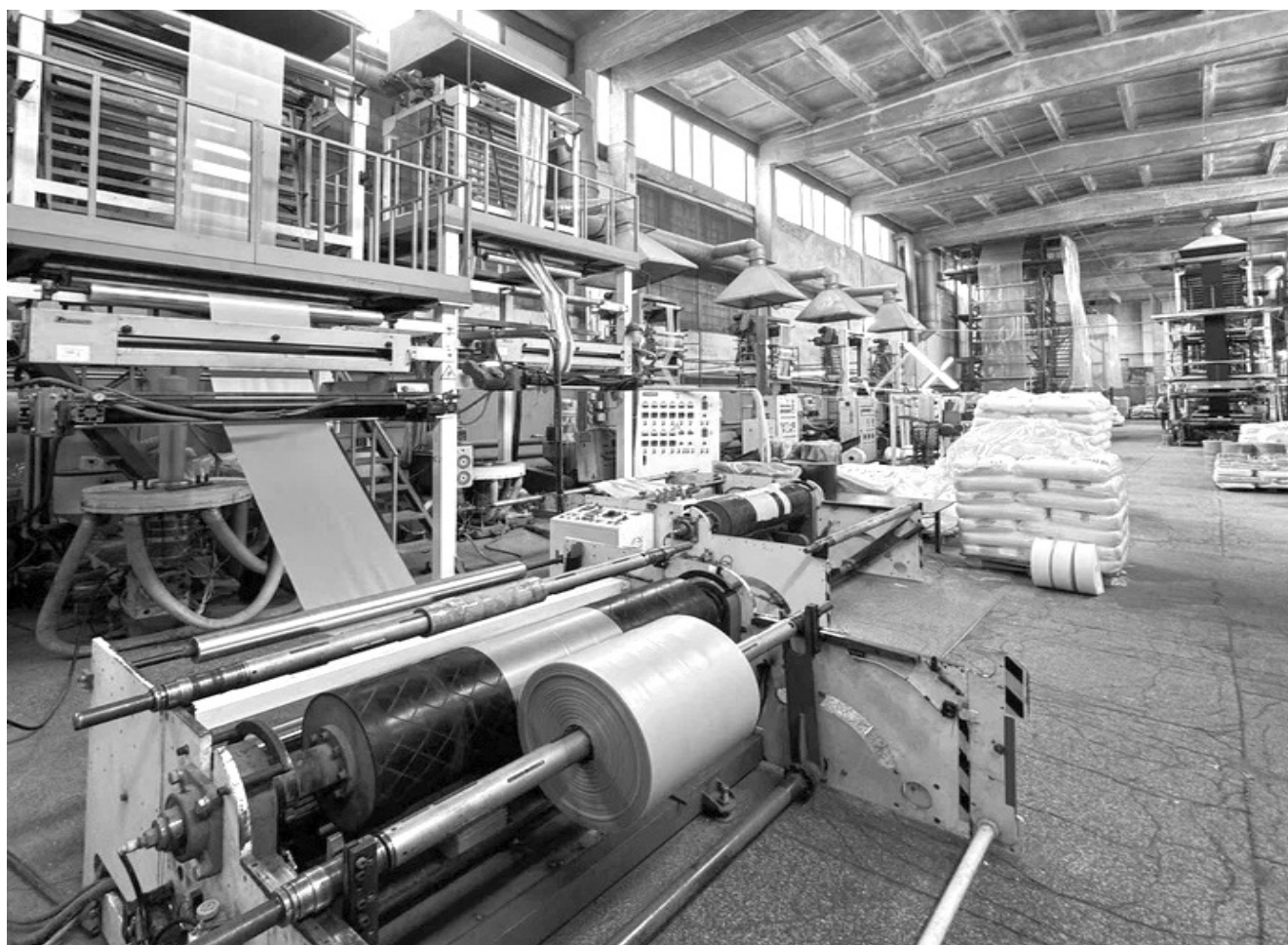
Производственный цех предприятия.

Средняя зарплата по предприятию была у зрячих 28 200 рублей, у инвалидов — 11 200, а в 2024-м году у зрячих уже 65 600, у инвалидов — 27 370. За последние десять лет предприятие ни разу не отправляло людей на простой. Значительно сократилось время протекания технологических процессов, почти на 50 процентов снизились запасы незавершённого производства, примерно на четверть увеличилась выработка продукции. Динамика впечатляет. И, что особенно примечательно, на «Крымпласте» эффективно используют поддержку из других источников. За «российские» годы от ВОС предприятие получило 44 миллиона рублей, а вернуло взносами 78 миллионов. Общий объём капитальных вложений с 2015-го по нынешний — 102 миллиона рублей.