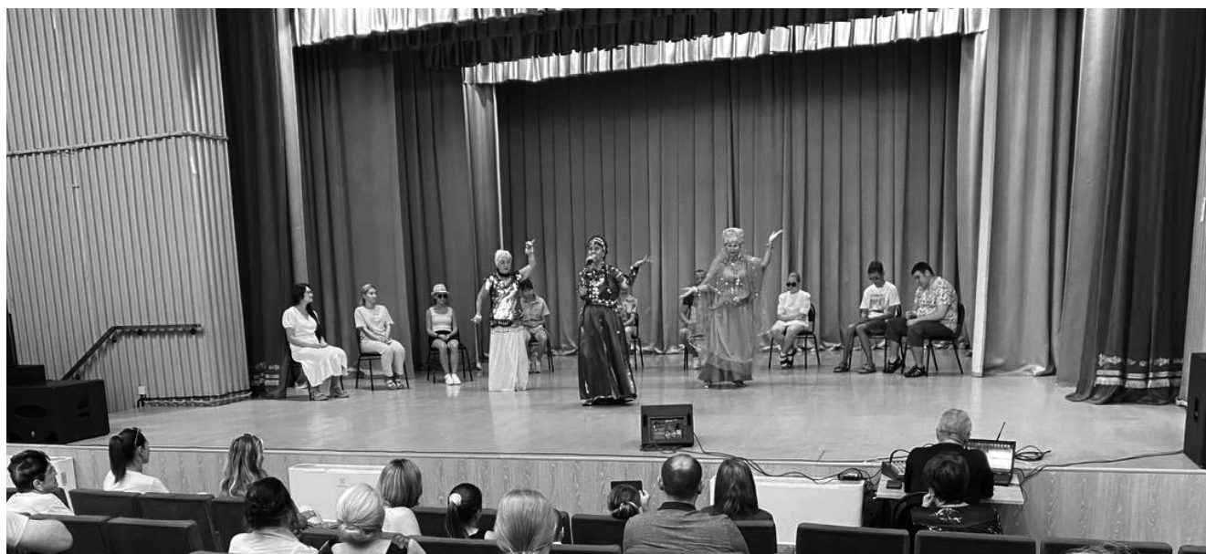
Танец — король сцены.