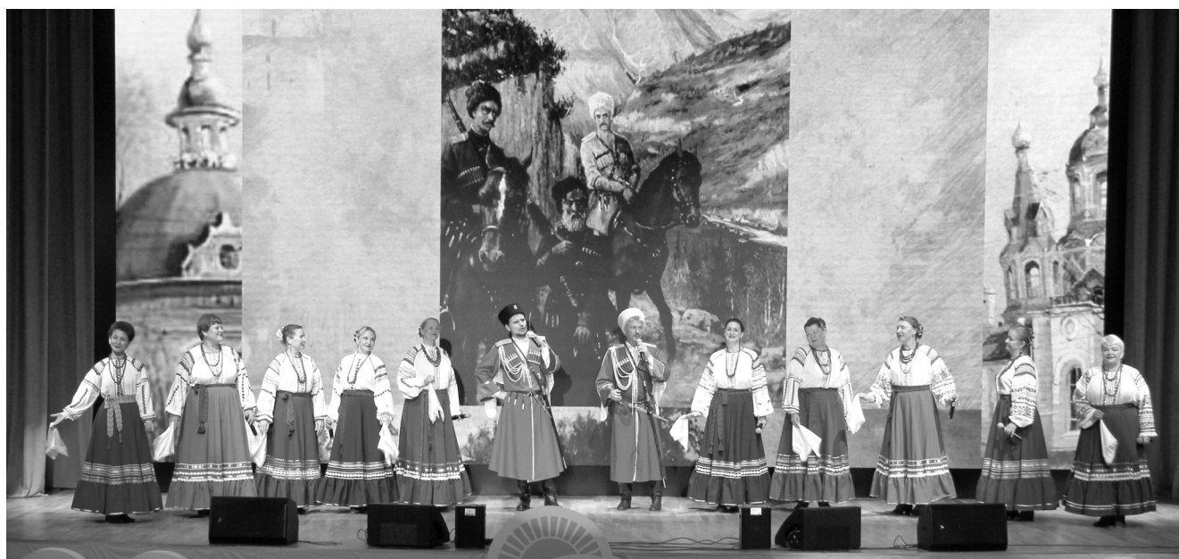
Народный ансамбль русской песни «Сударушка».

работник ВОС», нагрудные знаки «Почётный член Всероссийского общества слепых», почётные грамоты ЦП ВОС, а также почётные грамоты Краснодарской краевой организации ВОС.