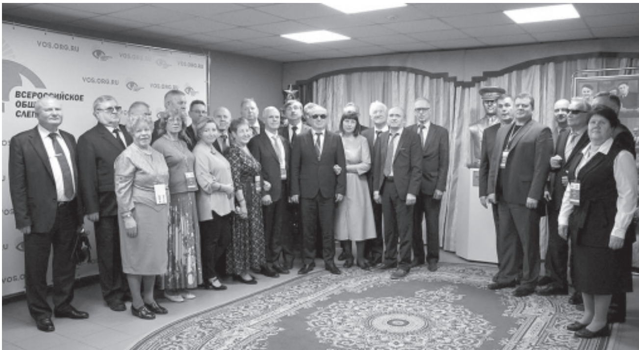
Новый состав Центрального правления.

После рассмотрения вопросов повестки дня XXIII съезда ВОС от делегатов поступило предложение завершить работу съезда. Большинство голосов предложение было принято. XXIII съезд